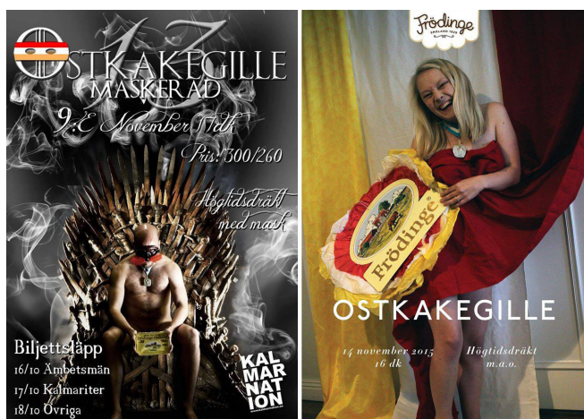
ENLIGT TRADITION ÄR 2Q MED PÅ OSTKAKANS AFFISCHER

Pssst, det ryktas om att det var 100 kg ostkaka på årets gille. Missa inte ostkakegillet nästa år!